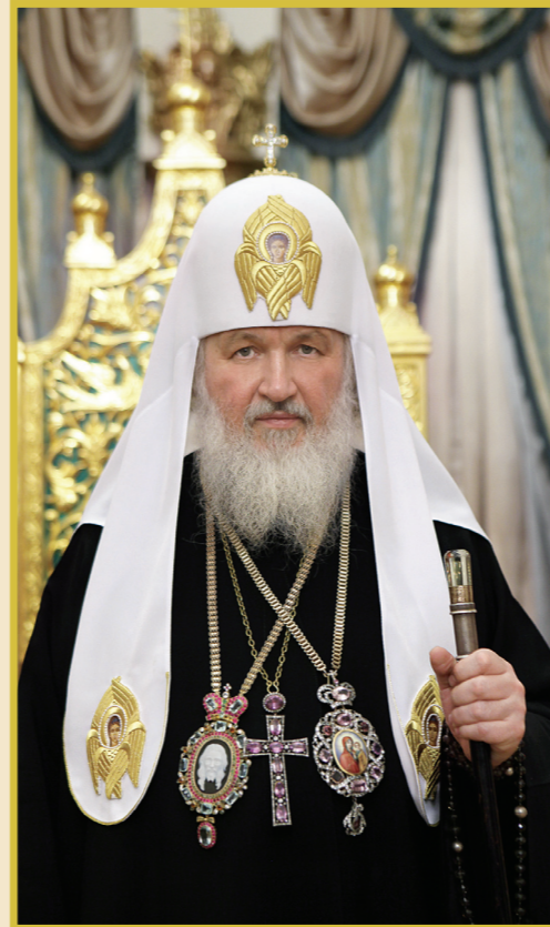
Из слова Святейшего Патриарха Московского и всея Руси Кирилла, произнесенного после восшествия на Патриарший престол

Вам предстоит много и неблагодарно трудиться. И сейчас и в будущем священные заветы первого и патриархального Патриарха: «Доброе дело — украшать и воздвигать церкви», — писал святитель Патриарх Ник, — не если в то же время мы будем окрещивать себя страданиями, то Бог не пощадит ни нас, ни наших церквей». — Встанет, как уже не раз бывало, из пепла и из бездны греховной новой Русь — Русь, дающая миру много подвижников веры и благочестия, Русь, создающая храмы в городах, весях и селениях. Русь, сияющая всему миру правдой и любовью, Русь Святая». Дай Бог, чтобы эти вдохновенные слова Святейшего Патриарха Алексея II стали пророческими.