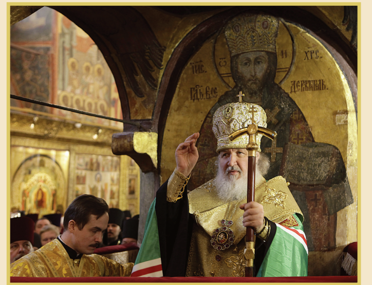
Из приветствия Святейшему Патриарху Московскому и всея Руси Кириллу председателя Центрального Совета