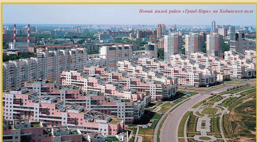
Новый жилой район «Гранд-Парк» на Ходынском поле

Реализация национального проекта «Доступное и комфортное жилье – гражданам России» привела к значительной активизации строительства во всех областях: от малоэтажной до комплексной застройки отдельных районов и даже городов.