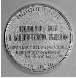
В ознаменование подписания Акта о каноническом общении Поместной Русской Православной Церкви и Русской Православной Церкви Заграницей по инициативе Общероссийского общественного движения «Россия Православная» была изготовлена Московским монетным двором и вручена официальным лицам памятная медаль с изображением Кафедрального Соборного Храма Христа Спасителя — места подписания этого исторического документа.