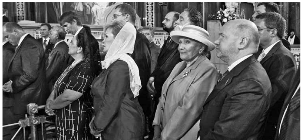
Справка: Зарубежная Русская Церковь — это часть Русской Церкви, которая временно отделилась от церковного центра в Москве, пока он был зависим от большевиков. Зарубежная церковь, находясь в эмиграции, не позволила поглотить себя ни нацистам, ни затем американским властям, представители которых пытались помешать воссоединению с Церковью на Родине. Зарубежная Русская Церковь объявила на весь мир об уничтожении Церкви большевиками и прославляла в 1983 г. новомучеников и исповедников российских. Это — подвиг правды, ведь в это время Церковь в России находилась под ярмом, с заткнутым ротом. Русская Церковь отставала по всему миру честь и достоинство русского народа, когда те, кто готовил и осуществил расчленение России, поддерживали украинских и прочих сепаратистов, принимали закон «О порабощенных нациях» (Конгресс США).

Зарубежная Русская Церковь неустанно повторяла, что русский народ является первой и главной жертвой коммунизма, и что именно большевики расчленили Россию, создав «самостоятельные» Украину, Белоруссию, Казахстан, отдав им и Прибалтике исконные русские земли. Зарубежная Русская Церковь сохранила наследие белой русской эмиграции, к ней принадлежали такие ее столпы, как Иван Ильин и Иван Солоневич. Вместе с Зарубежной Церковью возвращается и здоровый, а не суррогатный русский патриотизм, чистый, белый, без красных и коричневых пятен, преодолевающий главную беду русской политики — когда те, кто любит Россию, отрицают свободу, а те, кто говорит, что любит свободу, не любят Россию.