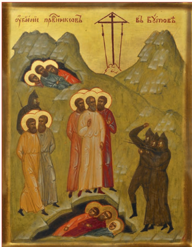
Убиение праведников в Бутове. Клеймо иконы «Собор новомучеников и исповедников Церкви Русской»