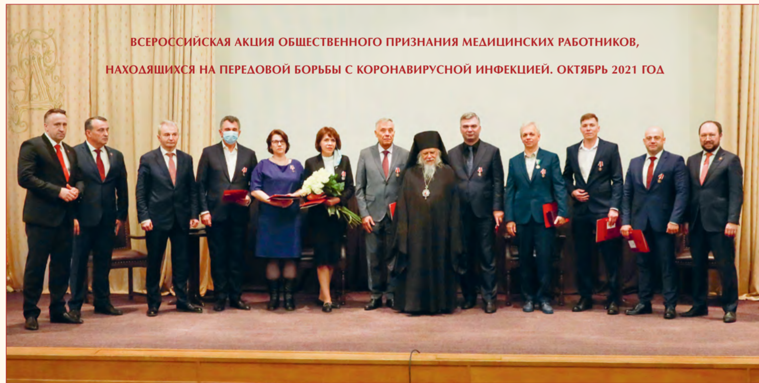
ВСЕРОССИЙСКАЯ АКЦИЯ ОБЩЕСТВЕННОГО ПРИЗНАНИЯ МЕДИЦИНСКИХ РАБОТНИКОВ, НАХОДЯЩИХСЯ НА ПЕРЕДОВОЙ БОРЬБЫ С КОРОНАВИРУСНОЙ ИНФЕКЦИЕЙ. ОКТЯБРЬ 2021 ГОД