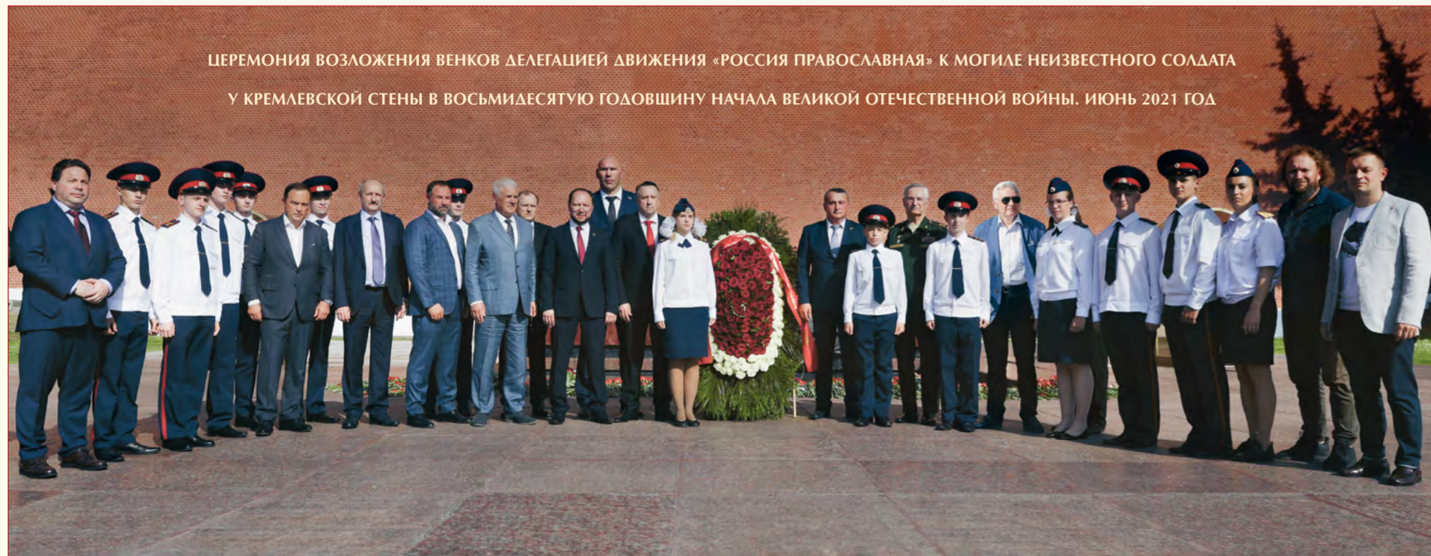
ЦЕРЕМОНИЯ ВОЗЛОЖЕНИЯ ВЕНКОВ ДЕЛЕГАЦИЕЙ ДВИЖЕНИЯ «РОССИЯ ПРАВОСЛАВНАЯ» К МОГИЛЕ НЕИЗВЕСТНОГО СОЛДАТА У КРЕМЛЕВСКОЙ СТЕНЫ В ВОСЬМИДЕСЯТУЮ ГОДОВШИНУ НАЧАЛА ВЕЛИКОЙ ОТЕЧЕСТВЕННОЙ ВОЙНЫ. ИЮНЬ 2021 ГОД