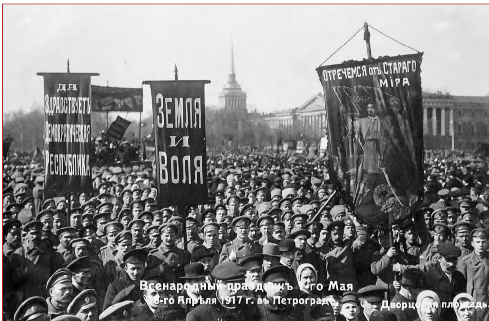
Всенародный праздник 1-го Мая 3-го Апрелья 1917 г. в Петрограде. Дворец на площади

Первая мировая война завершилась 11 ноября 1918 года. Германия подписала полную капитуляцию. Условия «мира» были настолько унижительными для Германии, что страна фактически становилась марионеткой. Поэтому, как пророчески заметил французский военачальник Фердинанд Фош еще в 1919 году, в день подписания мирного