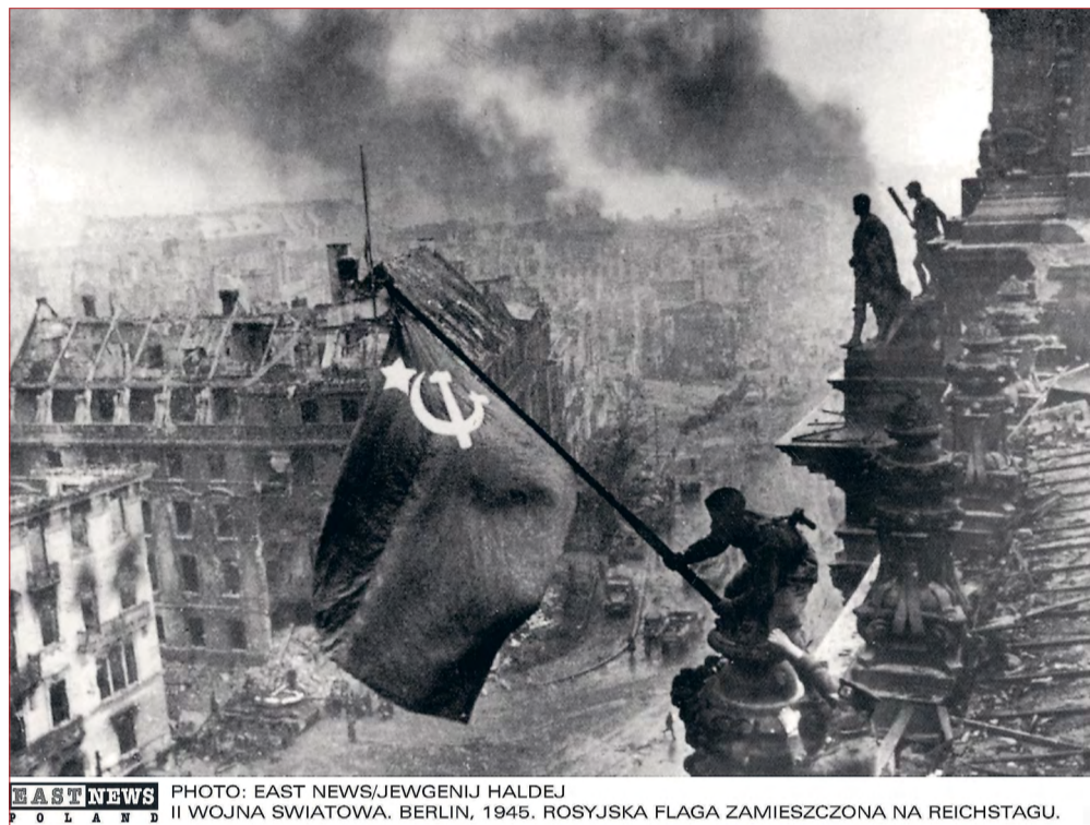
II WOJNA SWIATOWA, BERLIN, 1945. ROSYJSKA FLAGA ZAMIESZCZONA NA REICHSTAGU.

Эстония заявляет, что Вторая мировая война окончилась с развалом СССР. Болгария не считает борьбу СССР с нацизмом освобождением Европы. Германия благодарит лишь США за победу над нацизмом на Западе и на Востоке. За волной исторического вранья на праздновании 80-летия начала Второй мировой войны в Варшаве, куда нарочито не была приглашена Россия, стоит четкая стратегия. И сейчас она получила небывалую поддержку