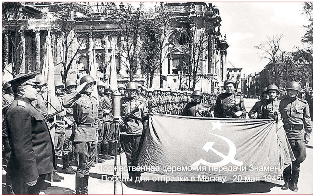
Торжественная церемония передачи Знамени Победы для отправки в Москву, 20 мая 1945 г.