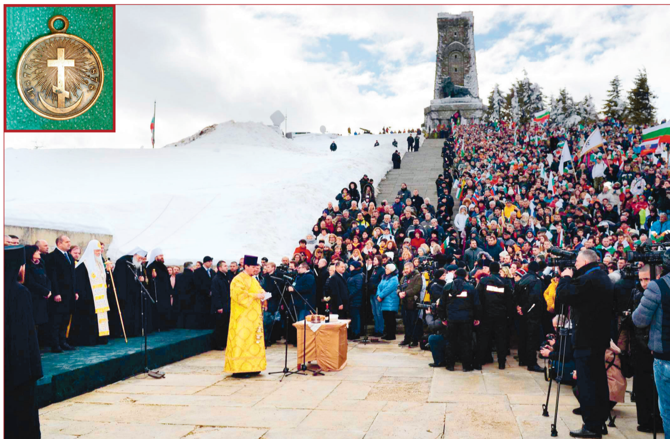
На фото: Святейший Патриарх Московский и всея Руси Кирилл, Святейший Патриарх Болгарский Неофит и Президент Республики Болгарии Р. Радев за литией об упокоении всех воинов, жизнь свою за веру и освобождение болгарской земли положивших

Послесловие к визиту Святейшего Патриарха Московского и всея Руси Кирилла в Болгарскую Православную Церковь, приуроченному к празднованию 140-летия освобождения Болгарии от османского ига