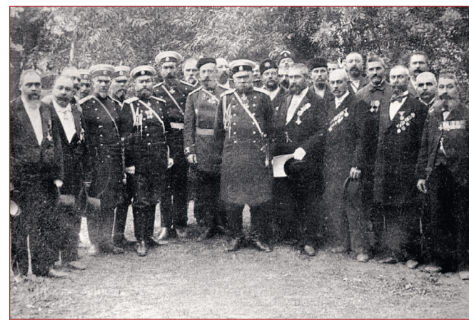
На фото: генерал Н.Г. Столетов среди болгарских ополченцев на праздновании 25-летия Русско-турецкой войны. 1902 г.

терь приводят западноевропейские источники. Так Э. Кнопп сообщает о 30 000 убитых, а доктор Г. Мораш – 36 455 убитых и умерших от ран. Непосредственный участник войны доктор Ю.К. Кёхер на основании неофициальных данных считает погибшими 27 000 человек.