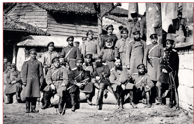
На фото сверху вниз: генералы Э.И. Тотлебен, М.И. Драгомиров, Ф.Ф. Радецкий, Н.Г. Столетов; офицеры и казаки из передового отряда генерала Н.В. Гурко в Тырново

гих этнических меньшинств, исповедующих христианство. Вспыхнувшее в XVIII веке на Балканском полуострове национально-освободительное движение славянских народов с невероятной беспощадностью подавлялось Турцией. Так, только при усмирении Апрельского восстания болгар весной 1876 году регулярной турецкой армией и «башибузуками» (буквально – «безбашенными») погибло свыше 30 тысяч человек, включая стариков, женщин и детей.