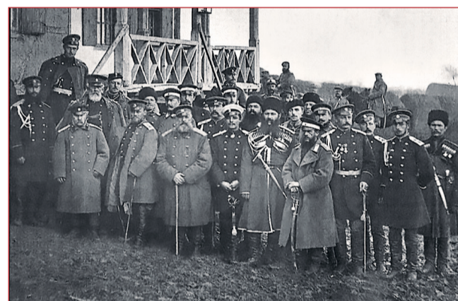
На фото сверху вниз: Император Александр II, генералы Н.Н. Обручев, Н.В. Гурко, М.Д. Скобелев; группа генералов и адъютантов перед резиденцией Александра II в Пордуме

в котором Россия начала борьбу за освобождение болгар: «Можете себе представить ситуацию, в которой было принято решение об ее участии в освобождении Болгарии? Вся Европа была против. Надо было преодолеть это «дипломатическое эмбарго» с тем, чтобы принять решение об участии русских войск в освобождении Болгарии. Россия не посмотрела на Европу: движимая своей любовью к болгарскому народу, хоть и будучи ослабленной в результате предыдущей войны, не имея никакой политической поддержки в мире, она начала борьбу за освобождение болгар. Это великий пример того, как духовная, культурная, религиозная солидарность превозмогает политический прагматизм».