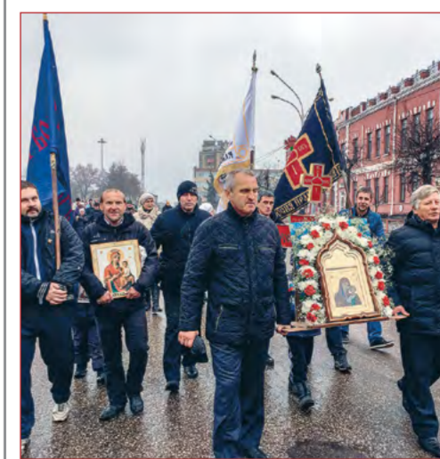
На фото: участники крестного хода

4 ноября в день празднования Казанской иконы Божией Матери и в День народного единства в г. Рассказово Тамбовской области состоялся традиционный крестный ход от храма святого апостола и евангелиста Иоанна Богослова до храма святой великомученицы Екатерины (протяженность более 3 км).