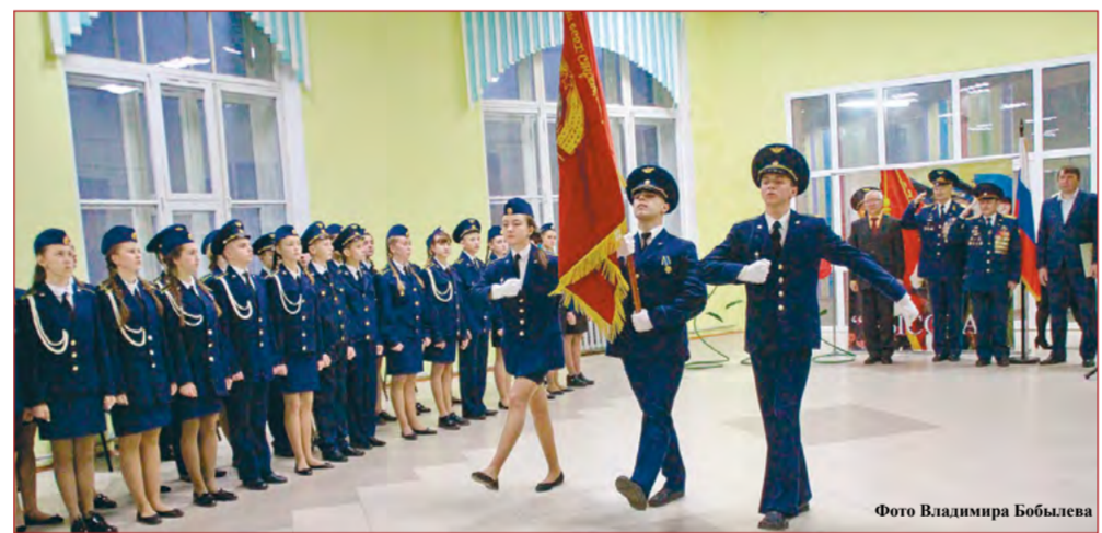
На фото: принятие присяги первокурсниками школы авиаторов «Высота»

7 ноября 2017 г. в ивановской гимназии № 32 состоялась торжественная церемония принятия присяги первокурсниками военно-патриотической школы авиаторов «Высота». В этот день 110 курсантов-новичков, из них 63 мальчика и 57 девочек, произнесли первую в своей жизни клятву верности и любви к Родине, чести и достоинству.