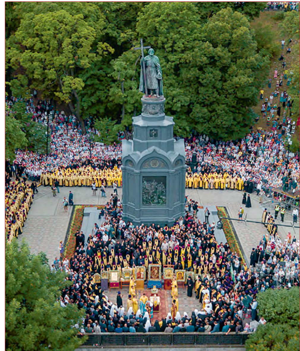
На фото: за праздничным богослужением на Владимирской горке в Киеве