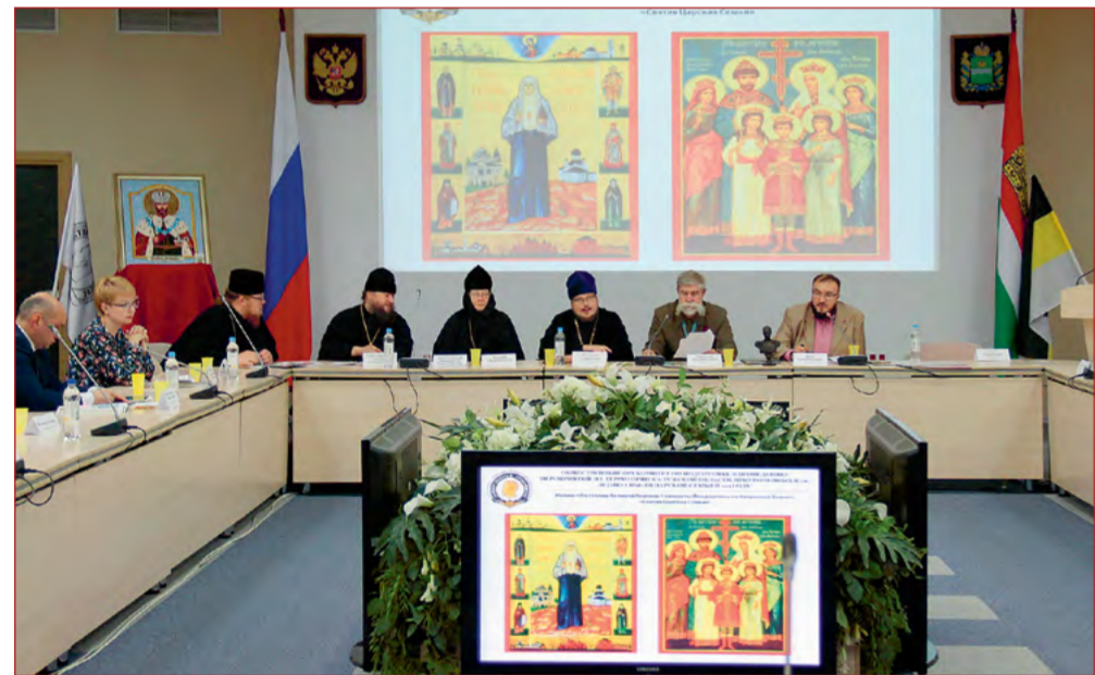
На фото: заседание Общественного оргкомитета

В 2018 г. отмечается скорбная дата: 100-летие мученической кончины Царской Семьи.