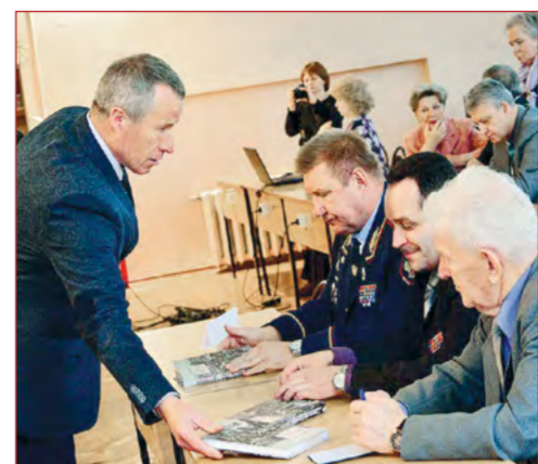
На фото: в Центральной универсальной научной библиотеке Ивановской области