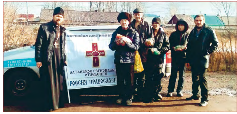
На фото: акция в поддержку бездомных в г. Рубцовске

Представители Алтайского регионального отделения ООД «Россия Православная» совместно с Рубцовской епархией 31 октября 2017 г. провели в г. Рубцовске акцию «Помоги ближнему».