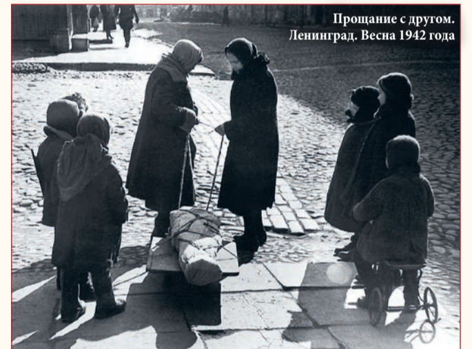
Прощание с другом. Ленинград. Весна 1942 года

Акты геноцида включают в себя не только расстрелы или работу лагерей смерти. Одним из самых ужасающих свидетельств запланированного уничтожения советского народа является блокада Ленинграда, во время которой, по разным оценкам, в городе погибли от 600 тыс. до 1,5 млн человек.