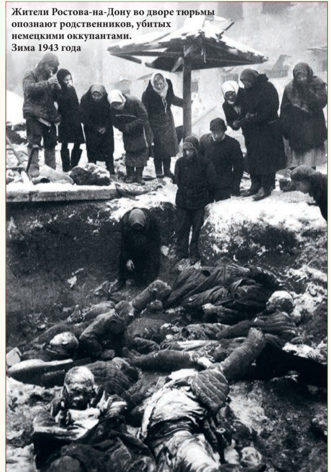
Жители Ростова-на-Дону во дворе тюрьмы опознают родственников, убитых немецкими оккупантами. Зима 1943 года

Еще одним способом истребления был тяжелый принудительный труд. Заключенных заставляли много работать, плохо кормили и практически не оказывали медицинской помощи. Как следствие люди оказывались истощенными, болели и умирали. Многих добивали охранники из числа подразделения СС, называвшегося «Мертвая голова». Вместе со взрослыми работали и малолетние дети – выращивали овощи на полях, копали землю, помогали на стройках. Кроме того, их использовали для проведения медицинских экспериментов и забора крови для нужд вермахта. Нередко после принудительного донорства дети умирали.