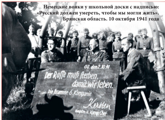
Немецкие воины у школьной доски с надписью: «Русский должен умереть, чтобы мы могли жить». Брянская область. 10 октября 1941 года

С приходом к власти Гитлера в 1933 году идея расширения жизненного пространства для немцев получила новое звучание. В своих выступлениях и публикациях нацистский вождь прямо утверждал, что «освоение земель на Востоке» является главной целью Третьего рейха. Нацистские идеологи «вспомнили», что когда-то давно славяне вытеснили племя готов из Северного Причерноморья и на этом основании объявили, что имеют право вернуть «украденные» территории. Постепенно в идеологии НСДАП антиславизм стал центральным компонентом.