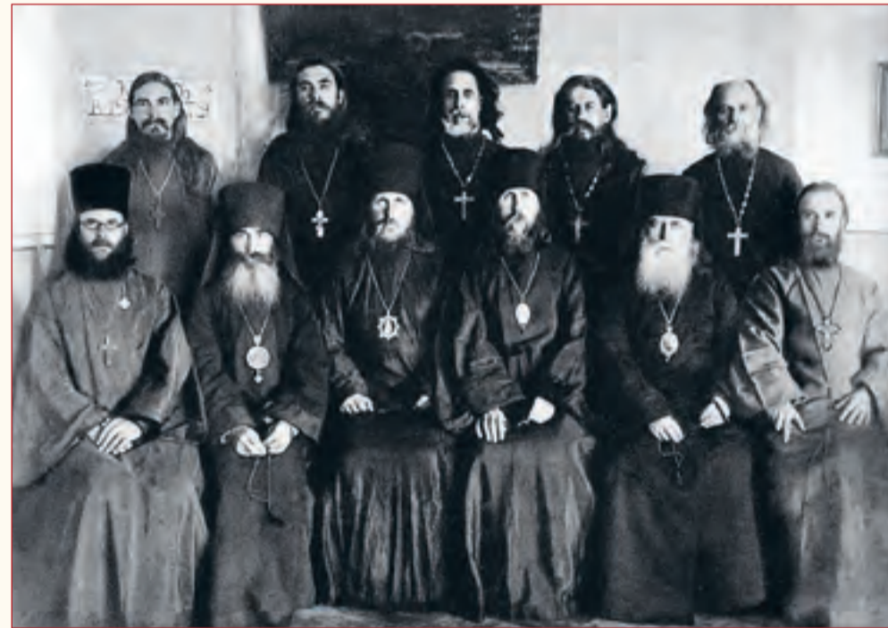
Православное духовенство в Соловецком лагере. Январь, 1923 год

Кипятку сплошь и рядом не отпускалось, так как котлы под обед и ужин занимались. Шла Пасха. И как хотелось, хотя и в такой затруднительной обстановке, совершить молитвенный обряд. «Как это так! — думал я, — пусть даже и сейчас, когда проснуться поговорить через толпу затруднительно, как не пропеть «Христос воскрес!» в пасхальную ночь!..»